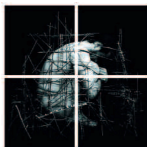
>>> Gulliver , 2008.