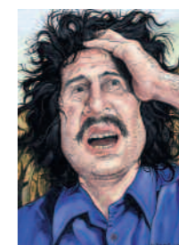
>>> Gabriel , 2004.

Après s'être attaquée, toujours de façon ludique, aux stéréotypes et aux tabous autour de la sensualité, l'artiste plasticienne France Cadet s'interroge sur le sort fait par les humains aux animaux. Subtilement programmés par l'artiste, à l'approche du spectateur, des trophées de chasse dignement alignés sur le mur s'animent pour s'insurger contre leur sort. Suivant du regard le visiteur, ils se font d'autant plus agressifs que se réduit la distance qui les sépare de leur interlocuteur. Ces têtes d'animaux représentées sous forme de robot posent aussi d'autres questions : les animaux auraient-ils tous disparu ? Les hommes chasseraient-ils désormais des robots ?