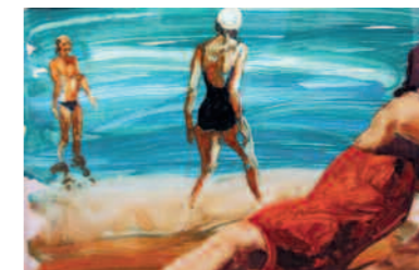
>>> Sans titre , 2007.

Petit-fils d'un pope orthodoxe, le peintre franco-serbe Kosta Kulundzic, installé à Paris, est marqué à la fois par le dogme chrétien et le poids du martyr. Son œuvre s'appuie sur les textes des Évangiles pour lesquels il propose une relecture qui s'inscrit de plain-pied dans la contemporanéité de notre société. Avec humour et légèreté, son style se rapproche de la BD. Ses références sont empruntées au Quattrocento et aux primitifs allemands comme Jérôme Bosch ou Jan Van Eyck qu'il affectionne tout particulièrement. Un travail minutieux qui permet d'apprécier l'expressivité des icônes d'aujourd'hui et laisse présager celles de demain.