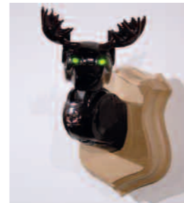
>>> Alces (Original) , 2008.

L'Américaine Nina Childress, peintre et musicienne, vit à Paris depuis la fin des années 1970. Ses œuvres sont à la fois singulières et troublantes. Dans la série RVB , l'artiste met en scène sur de grands formats des décors d'une autre époque, tantôt kitsch et colorés, tantôt composés de noir et de blanc. La couleur sert ici de repère dans le temps. L'œuvre fascine : aucun être humain ne se montre, mais tous les décors évoquent sa présence. Si les mécanismes du regard et de la perception sont au cœur des recherches de l'artiste, les thèmes abordés dans cette série sont ceux de l'absence et de la réminiscence d'un passé figé dans la mémoire à la manière d'un cliché.