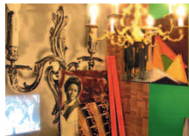
>>> Toile de la série RVB , 2008.

Originaire de Bretagne, Pascal Mirande crée des univers singuliers où se confrontent des constructions fictives et des paysages réels. Chacune de ses œuvres fait appel à la vigilance pour discerner le vrai du faux. Ces clichés photographiques teintés de sépia racontent des souvenirs imaginaires pour lesquels l'artiste s'est inspiré du cinéma muet, de la conquête spatiale ou encore de la mémoire collective. Jouant de cadrages, de perspectives et de changements d'échelle, des mondes enchanteurs prennent corps et le doute s'immisce dans le regard du spectateur. Un travail documenté dans lequel interviennent la sculpture et le dessin, nécessaires à l'installation qui sera immortalisée par un cliché.