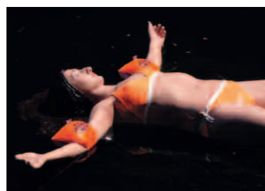
>>> Bercée par l'eau , 2008.

déambulations. L'artiste filme en contre-plongée, caméra arrimée à la taille du sujet, les jambes d'une femme marchant tantôt sur une plage, tantôt sur le macadam, ou encore sur un sentier forestier. Dans une atmosphère où le mouvement se conjugue aux jeux d'ombre et de lumière, le sol semble se dérober et nos sens perturbés changent la perception de l'espace. Cette caméra au corps à la frontière de l'intime et du monde extérieur évoque à la fois une vie intérieure et un rapport au monde. Depuis 1999 l'artiste vit et travaille à Paris.