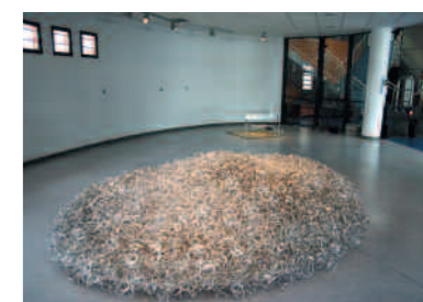
>>> Négropolitide , 2008.

S'il bénéficie d'une reconnaissance au plan international, Eric Fischl (né à New York en 1948) apparaît en 1979 avec sa première toile comme le chroniqueur acide de la vie américaine et s'inscrit d'emblée dans le courant de la nouvelle figuration. Sa peinture s'inspire de la réalité et l'utilisation de modèles photographiques induit d'emblée un certain naturalisme dans l'œuvre. Ses expériences de jeunesse sont restées le thème principal de sa peinture ; l'artiste énonce, non sans ironie, les tabous de la société. D'un tableau à l'autre émanent des tensions érotiques et psychiques qui à une certaine époque ont fait scandale. Véritable virtuose de la couleur, il s'exprime dans un langage pictural direct et sans remords.